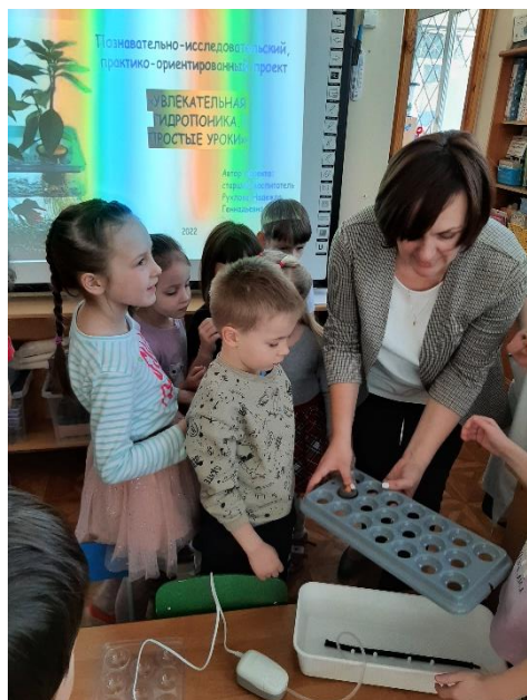
Знакомство с устройством «Чудо-грядки»