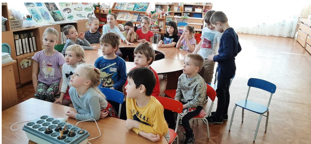
Просмотр презентации «Увлекательная гидропоника. Простые уроки»