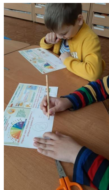
Экспериментирование по определению уровня pH воды