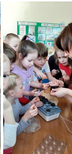
Посадка лука, семян базилика и салата в «Чудо-грядку»