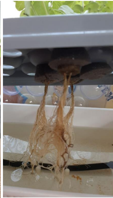
Наблюдение за работой «Чудо-грядки», ростом растений и развитием корневой системы